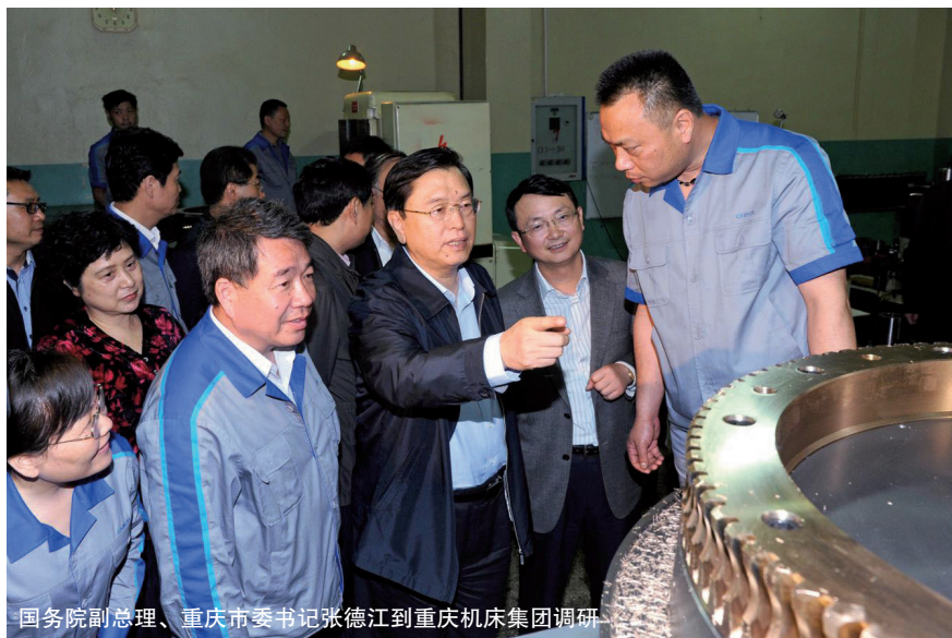
国务院副总理、重庆市委书记张德江到重庆机床集团调研

在行业过去 10 多年的高速发展过程中,若与行业经济规模的迅猛增长相比,行业的转型升级效果则相对逊色。那么如何做好转型升级?在转型升级的过程中,我们不得不考虑的一个问题就是:我们与发达国家的差距到底在哪里呢?针对这个问题,吴柏林先生告诉记者,在行业发展实践中我们深切体会到,我们